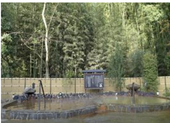
「佐倉染井野温泉と竹林」