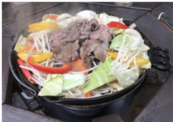
「遠野式バケツジンギスカン」