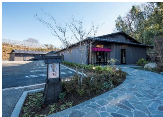
佐倉天然温泉 澄流 「施設外観」

また、軽食が可能な休憩スペース「ラウンジ」や、リラクゼーションスペースも「癒処華美-HANABI-」として新装開店いたします。