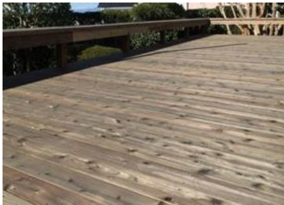
屋久島地杉使用 「ととのいデッキ」

屋久島地杉は、一般的な杉に比べ、誘眠作用が実証されているセドロールなどの芳香成分が約20倍含有されていることから、安眠や睡眠効率を高めたり、気分を落ち着かせる効果が期待できるとされています。