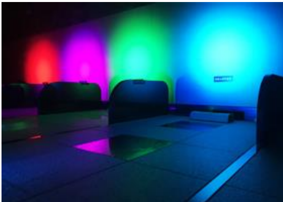
「ミュージックロウリュ」

岩盤浴利用者専用の休憩スペース「岩盤専用ラウンジ」ではコーヒーや紅茶、ハーブティー、マッサージチェア、コミックを無料でご利用いただけます。